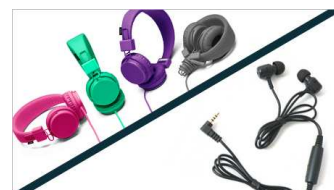
Une paire d'écouteurs ou un casque audio personnel (à ranger dans une boîte au nom de l'élève)