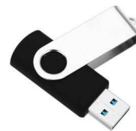
Une clé USB