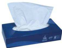
2 boîtes de mouchoirs en papier